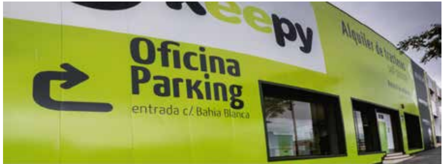
Uno de nuestros centros en Málaga

Conseguirás una gran rentabilidad, con una inversión única, sin apenas mantenimiento y unos costes mensuales mínimos.