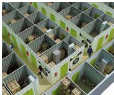
Ejemplo de estructura