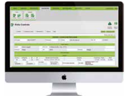
Sistema de gestión (CRM)